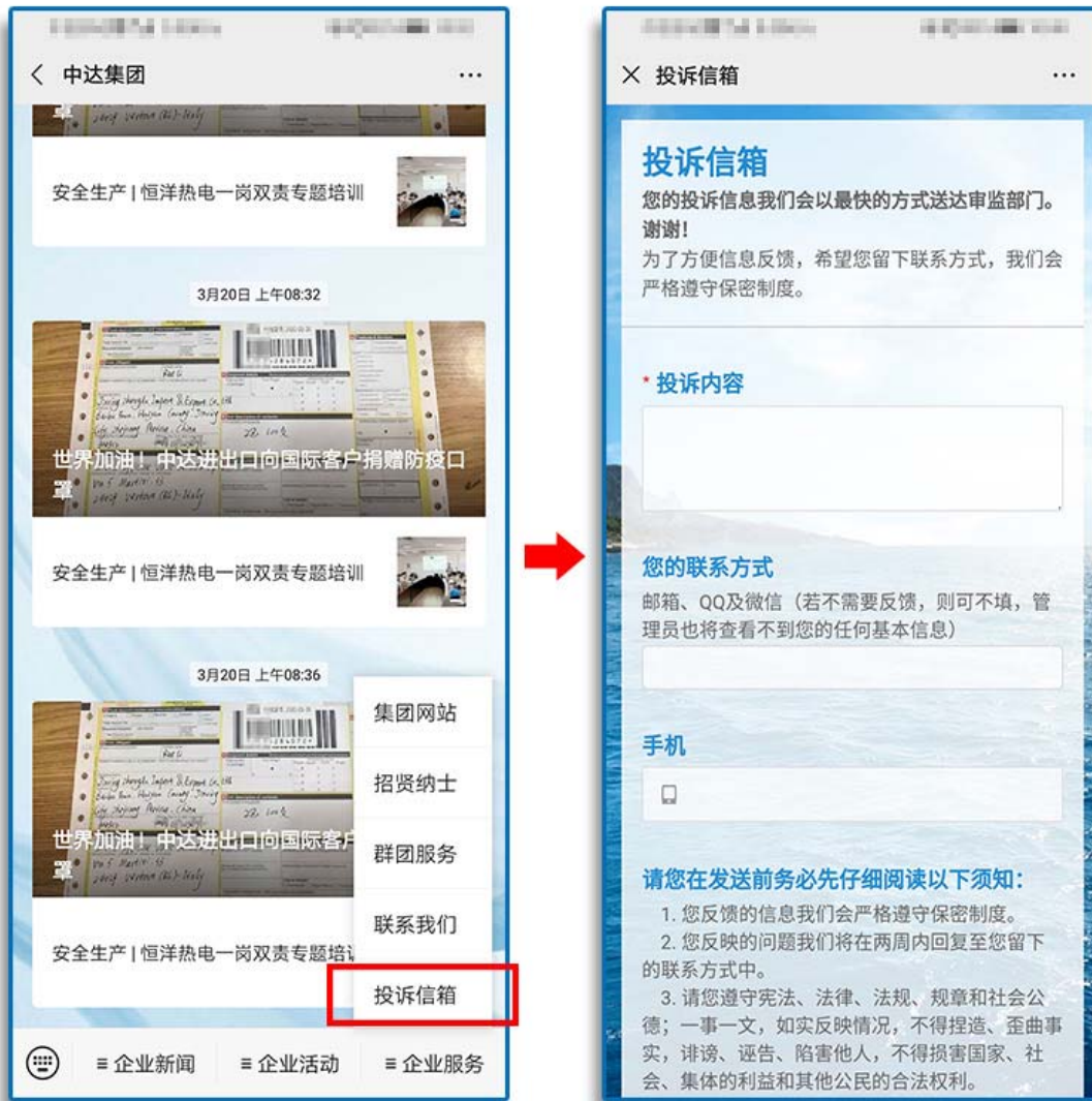
公司微信公众号投诉信箱