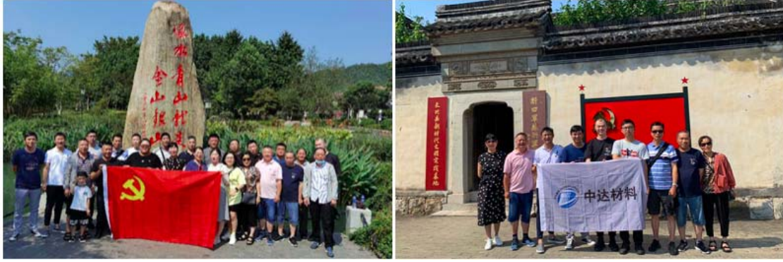
中达材料党建活动