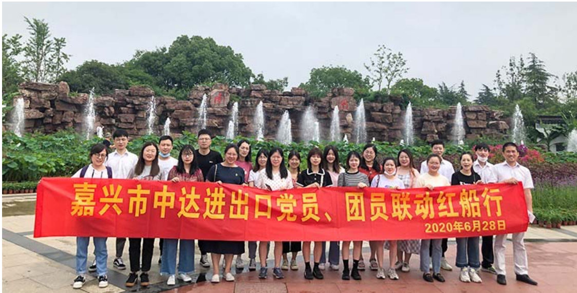
中达进出口党团联动活动

公司重视员工关怀，定期走访慰问困难员工及家属，了解困难员工需求，关心并跟进其生活改善情况。此外，公司为特殊群体提供个性化福利，在“三八”节、“六一”节、春节等节日期间送上问候与祝福。