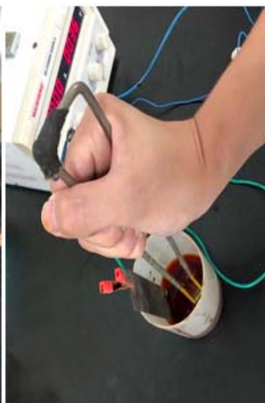
中达材料金相检验业务技能实践操作培训