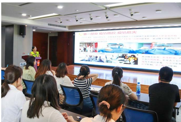
中达进出口急救知识培训