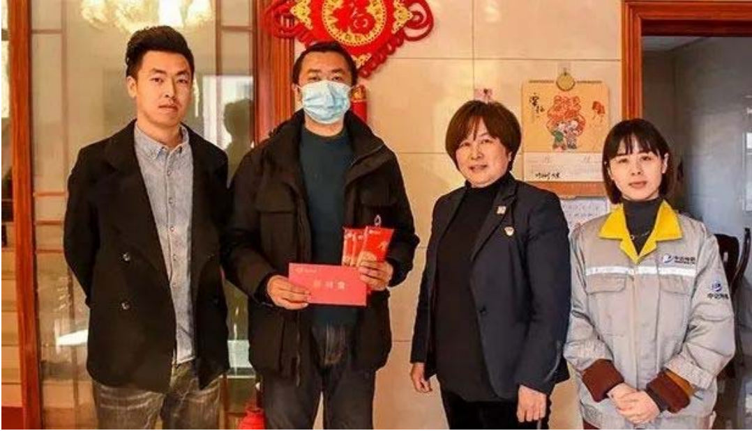
困难员工慰问活动