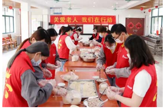
“关爱老人”志愿服务活动

一场突如其来的新型冠状病毒肺炎疫情牵动着全国人民的心，一方有难八方支援，公司及时向海盐县慈善总会捐款 70 万元用于新冠疫情防控。同时，公司发动全体党员积极捐款，广大党员积极响应，通过微信转账、现场捐款等形式献出爱心。