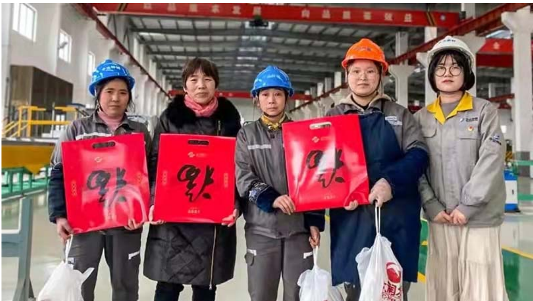
留“盐”过年新居民员工慰问活动