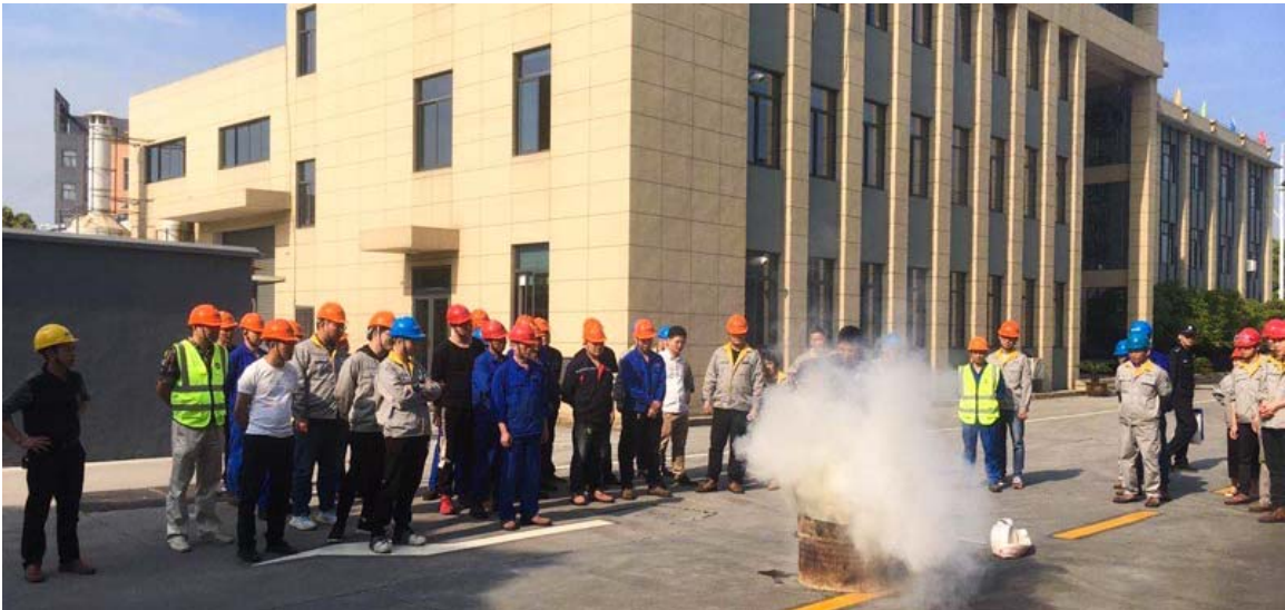
中达新材消防演练

安全生产在于防范于未然。公司通过采取播放安全视频短片、悬挂安全警示横幅等措施，大力宣传安全防范的重要意义，提高全体员工的安全意识。同时，公司按照安全生产应急管理的要求，结合行业特点，编制了《突发事件综合应急预案》和《生产安全事故应急预案》，并上报海盐县安监局备案。公司在日常运营中注重安全生产应急管理工作，切实提升应急管理能力。加强应急能力建设，做好应对突发事件的准备；强化应急培训和应急演练，锻炼各级应急救援处置队伍，熟练掌握应急设备和器材的使用、应急处置程序和方法，规范应急事故处理流程。