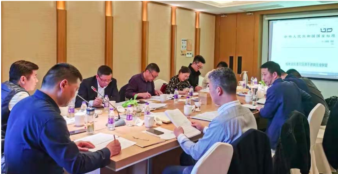
中达新材主导国家标准制定

2020 年，中达新材审定并报批国家标准（GB）氧气管线、高压加氢不锈钢无缝钢管及卫生级不锈钢洁净管等 3 个标准，核级不锈钢仪表管在国家标准审评中心成功立项（项目号 2020100170）；同时，自主研发项目“石化用 N08811 炉管”，根据项目进展需要转在中关村材料试验联盟 CSTM 立项并开展，省重大专项超级双相钢无缝钢管通过专家组年度中期验收。