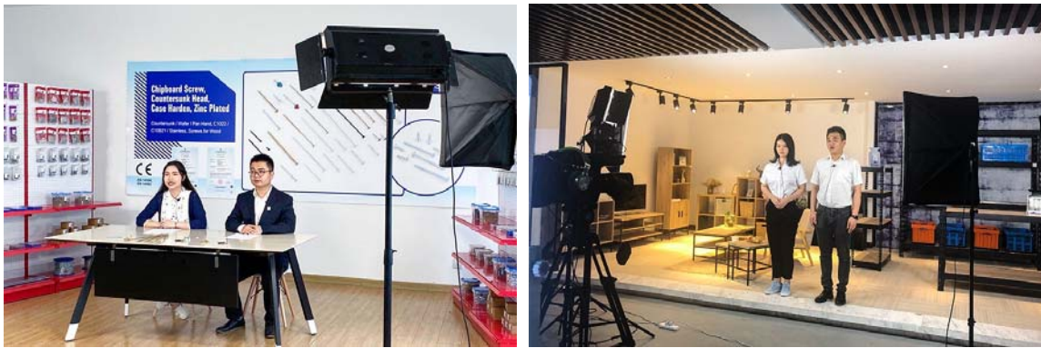
中达进出口开展线上广交会

公司将客户信息纳入公司核心商业秘密范畴，严格保密客户信息及独立建档，由专人负责信息收集、归档、更新，并设定相应的信息查询和导出权限，确保客户信息安全。2020年，公司未发生网信安全事件或侵犯客户隐私权利的案例。