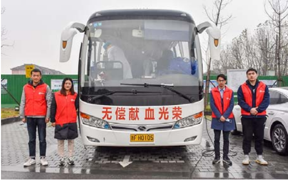
无偿献血志愿服务活动