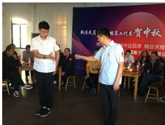
中达材料中秋活动