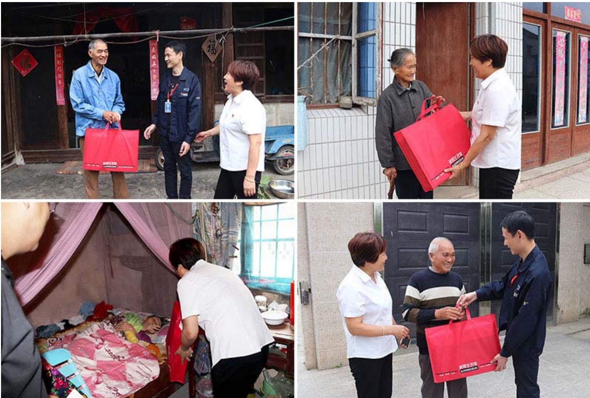
走访慰问困难老人

我们持续关注自身在社区可持续发展、员工志愿活动等方面的表现，每年设立专门预算，用于资助当地社区的教育、居住环境改善、基础设施建设和居民慰问等。通过开展关爱下一代、爱心捐赠以及走访慰问等形式多样的公益活动，积极承担企业公民的责任，多方面回馈社会。