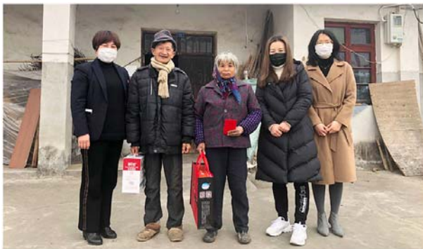
“三八”节困难女职工慰问活动

公司重视员工关怀，定期走访慰问困难员工及家属，了解困难员工需求，关心并跟进其生活改善情况。此外，公司为特殊群体提供个性化福利，在“三八”节、“六一”节、春节等节日期间送上问候与祝福。