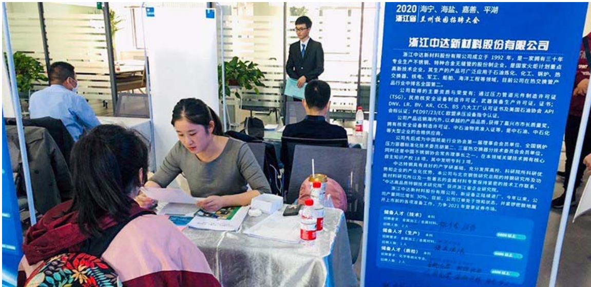
中达新材招聘活动

公司依法保护员工相关权益，依据《劳动法》《劳动合同法》《劳动合同法实施条例》等法律法规，与员工签订劳动合同，明确公司和员工双方的权利和义务，并严格遵守执行。公司遵守国家相关的法律法规，保障员工合法权益，禁止使用童工，不允许强制劳工。公司坚持按劳分配原则，实行就业机会平等和同工同酬制度，对性别、年龄、疾病、种族、宗教信仰等没有歧视政策。截至 2020 年底，公司残疾人雇佣人数为 7 人。