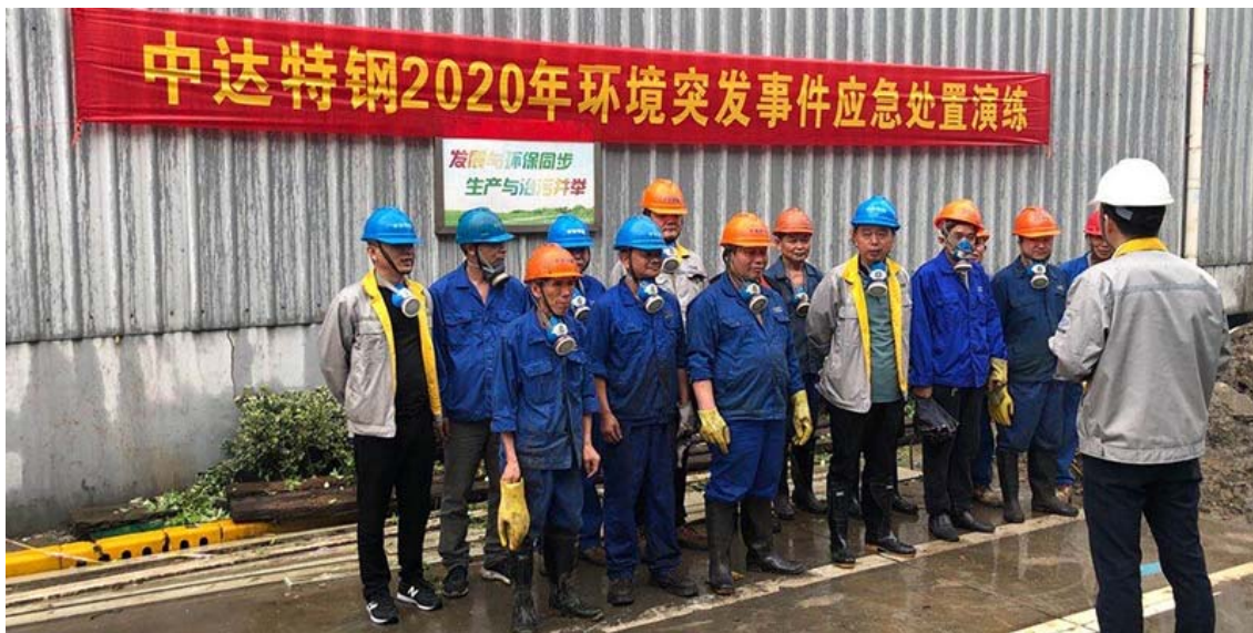
中达新材环境突发事件应急处置专项演练