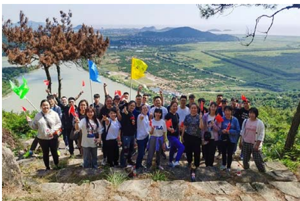
中达新材团建活动

公司致力提升员工工作环境和组织氛围，开展团建活动、员工生日会、节日庆祝活动、体育活动、党建活动等有益员工身心健康的集体活动，提高员工的凝聚力与归属感。