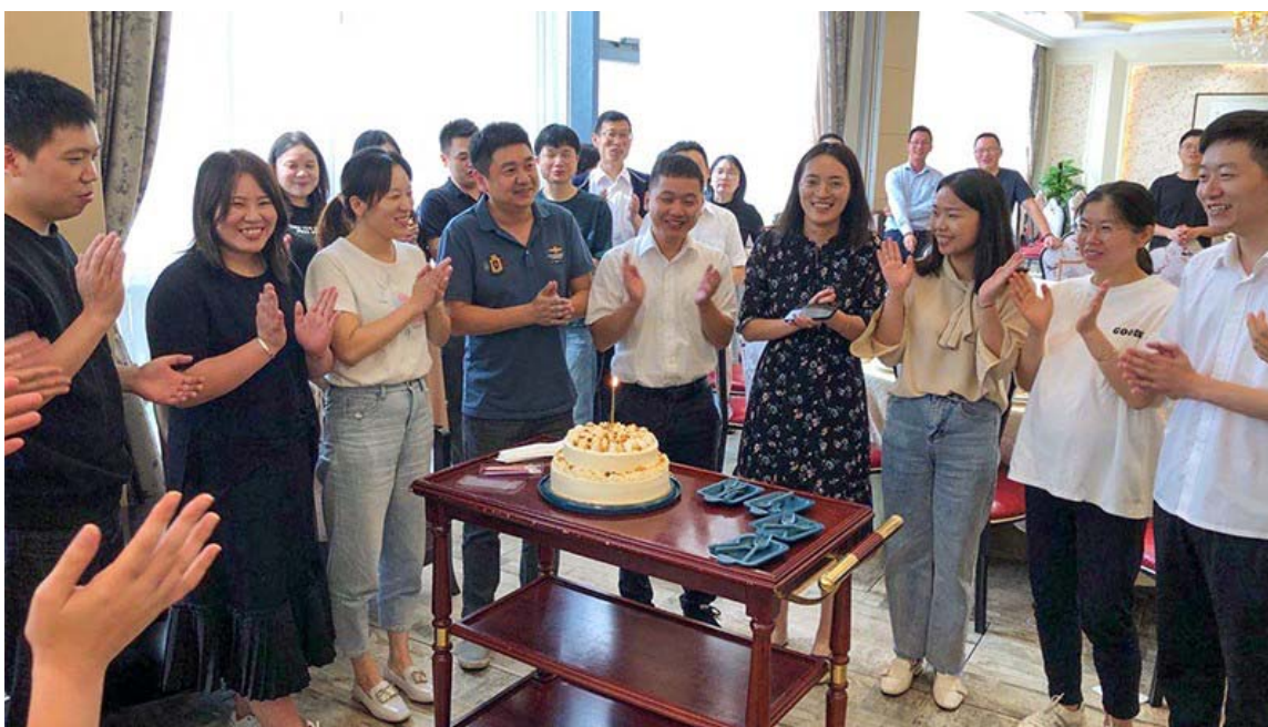
中达进出口员工集体生日会