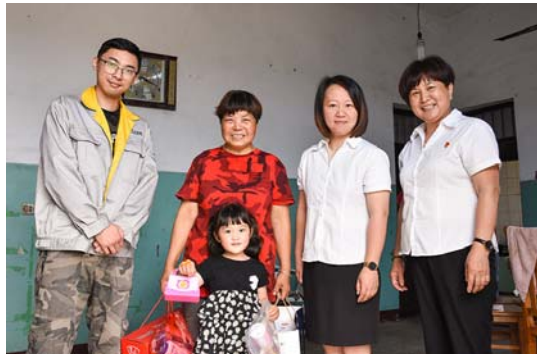
“六一”儿童节关爱活动