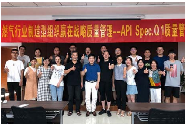
中达新材质量管理体系培训