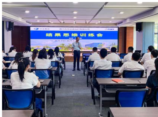
中达进出口企业文化培训