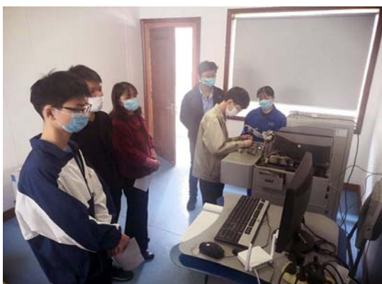
中达材料实验室仪器设备专题培训